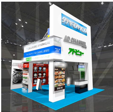
出展ブースイメージ

同展は、看板・施設サイン、ディスプレイ業界の最新技術や商品の情報提供・認知の場として関連企業が出展する展示会です。当社は、外照式サイン用 LED 電装ユニット「アドビューシリーズ」および「LED チャンネル文字」を中心に展示いたします。照射距離で選べるアドビューシリーズのラインナップも充実し、今年 2 月に発売した LED 照明付きバナー「アドビューバナー」なども取り揃えます。また参考出展として、スマートフォンに情報を提供できる「光 ID」技術を組み込んだ商品などの出展も予定しております。