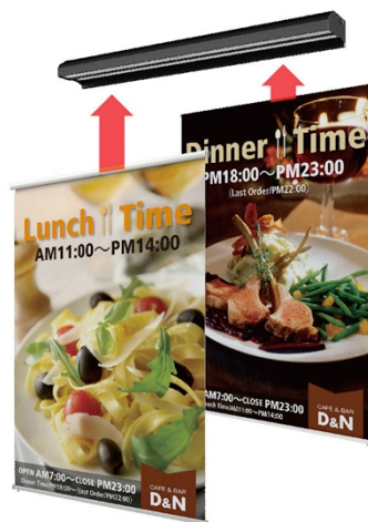
アドビューバナー