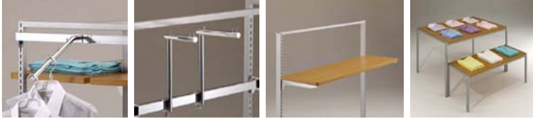
フェイスアウトフック（傾斜・アップ水平） / 木棚 / ディスプレイテーブル

当社の既存シリーズ（プロショップ・プロソリッド）のオプションパーツも使用できます。