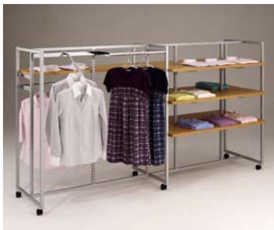
「SQ シリーズ」に「木棚」「バー」「フック」を組み合わせた使用例