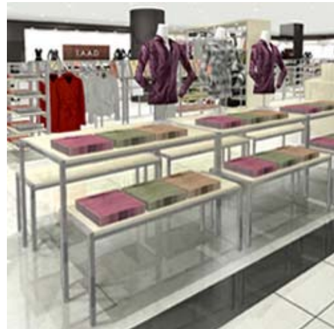
「アパレルショップシリーズ」を使用した店舗イメージ