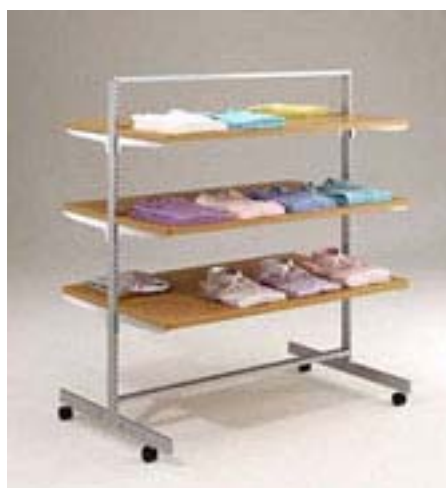
「ST シリーズ」に「木棚」を組み合わせた使用例